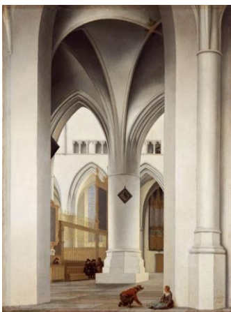
7. Pieter Jansz. Saenredam (Assendelft 1597 - 1665 Haarlem), Intérieur de l'église Saint-Bavon de Haarlem, 1636 ; 48,8 x 36,5 cm ; inv. 396