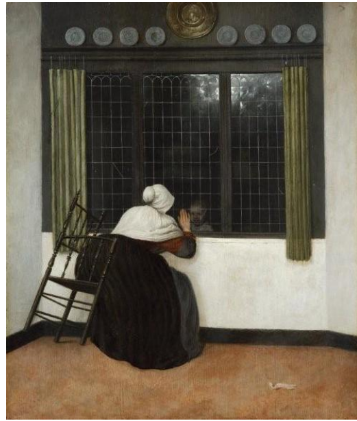
3. Jacob Vrel (actif vers 1654 - 1670?) Femme à la fenêtre faisant signe à une enfant , vers 1650 45,7 x 39,2 cm ; inv. 174