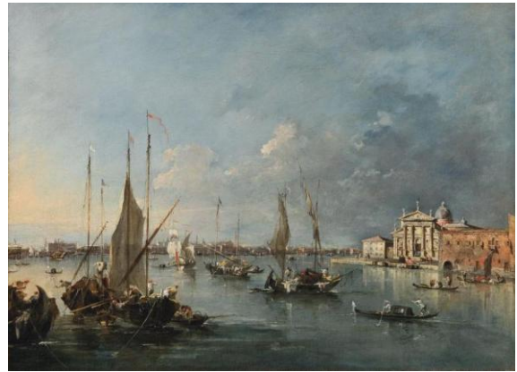
8. Francesco Guardi (Venise 1717 - 1792 Venise) Isola San Giorgio à Venise 48 x 66 cm ; inv. 2389