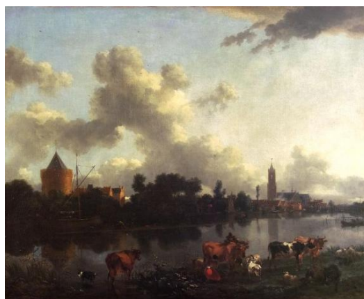
Fig 1 : Nicolaes Berchem. Vue de Loenen sur la Vecht, avec le château de Cronenburch , vers 1655-1660

De même, la calme étendue d'eau dans la Vue d'un canal avec des voiliers et un moulin est une exception dans l'œuvre de Ludolf Backhuysen , peintre de marines tempétueuses.