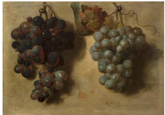
9. Nicolas de Largillière (Paris 1656 - 1746 Paris) Deux grappes de raisin, 1677 24,5 x 34,5 cm ; inv. 6062