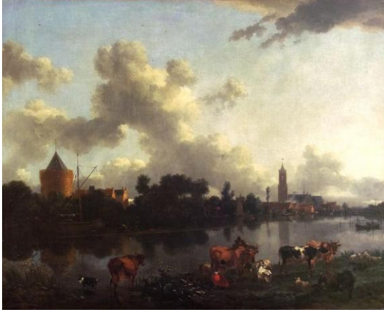
1. Nicolaes Berchem (Haarlem 1620 - 1683 Amsterdam) Vue de Loenen sur la Vecht, avec le château de Cronenburch , vers 1655-1660 91,3 x 114,5 cm ; inv. 6811