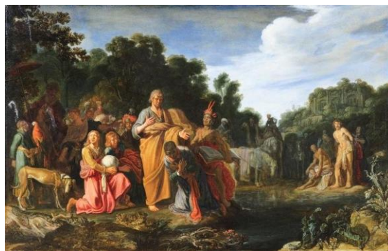
Fig.5 : Pieter Lastman, Baptême de l'eunuque

Ces restaurations furent en outre l'occasion de chercher pour certains de ces importants tableaux des cadres hollandais ou flamands d'époque qui mettent parfaitement en valeur les représentations qui furent prévues pour ce type d'encadrement.