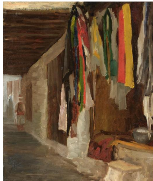
15. Eugène Isabey (Paris 1804 - 1886 Paris) Le Souk d'Alger, l'échoppe du teinturier , 1830 28,8 x 24,5 cm ; inv. 2011-S.10