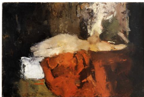
Fig. 3 : George Breitner, Jeune Femme aux bas noirs

A ses débuts, George Hendrik Breitner (1857-1923) fait lui aussi partie de l'École de La Haye, avant de s'installer à Amsterdam. Peintre et photographe, ami de Van Gogh, Breitner est l'un des plus grands artistes hollandais de la fin du siècle et certainement celui qui a le mieux su représenter les thèmes de la modernité. Le titre Un univers intime ne saurait mieux convenir à sa Jeune femme aux bas noirs que la Fondation Custodia vient d'acquérir (fig. 3).