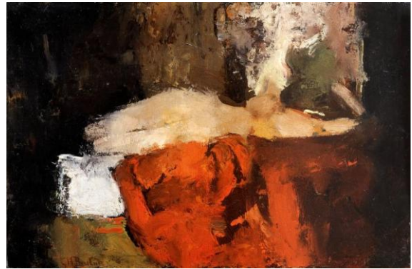
14. George Breitner (Rotterdam 1857 - 1923 Amsterdam), Jeune Femme aux bas noirs 20 x 30 cm ; inv. 2011-S.19