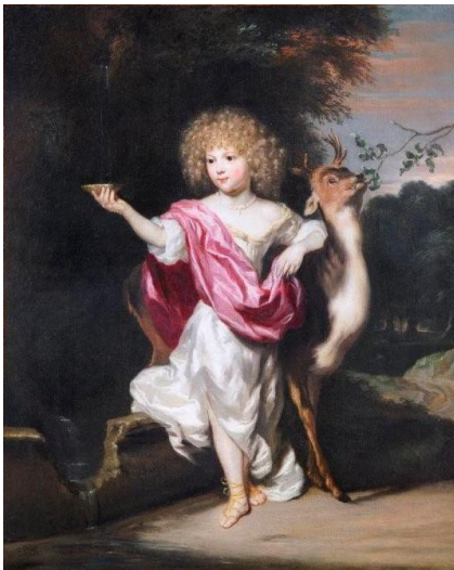
6. Nicolaes Maes (Dordrecht 1634 - 1693 Amsterdam) Portrait d'une petite fille avec un chevreuil 58 x 49 cm ; inv. 2011-S.3