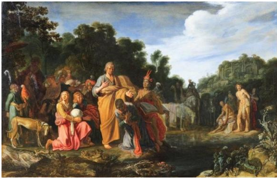
5. Pieter Lastman (Amsterdam 1583 - 1633 Amsterdam) Baptême de l'eunuque 63 x 99 cm ; inv. 4886