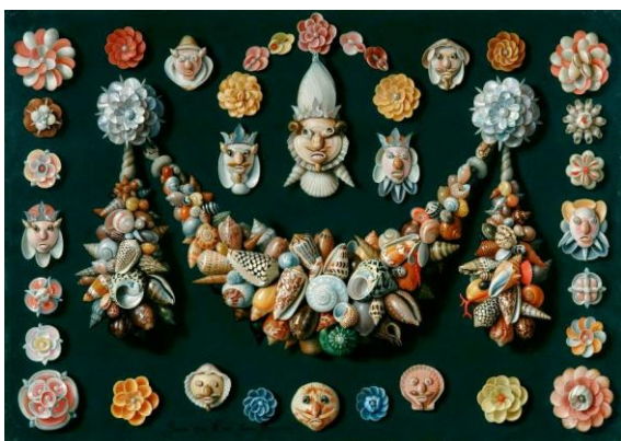
Fig.4 : Jan van Kessel l'Ancien, Festons, masques et rosettes de coquillages , 1656

On y retrouvera la dynastie des Brueghel avec Jan l'Ancien, que l'on appelle souvent Brueghel de Velours (1568-1625). Dans la Visite à la métairie , il délaisse ses paysages et ses natures mortes de fleurs alors si prisés à la cour papale notamment, pour fournir une variation sur le thème paysan et la technique en grisaille pratiqués par son père, Pieter Brueghel le Vieux. Fait-il là une copie d'après une composition existante ou bien invente-t-il de toute pièce un nouveau tableau ? La question n'est pas tranchée mais il s'agissait certainement de répondre à la demande des collectionneurs qui lui réclamaient des œuvres de son père.