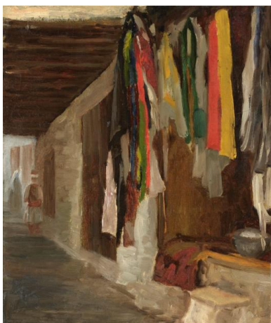
Fig 2 : Eugène Isabey, Le Souk d'Alger, l'échoppe du teinturier , 1830

Pour les Danois – domaine si peu représenté dans les collections publiques françaises – on pourra admirer des vues d'Italie de Martinus Christian W. Rørbye (1803-1848) ou de Johan Thomas Lundbye (1818-1848) ainsi que des esquisses baignées de lumière danoise comme celles de Vilhelm Kyhn (1819-1903).