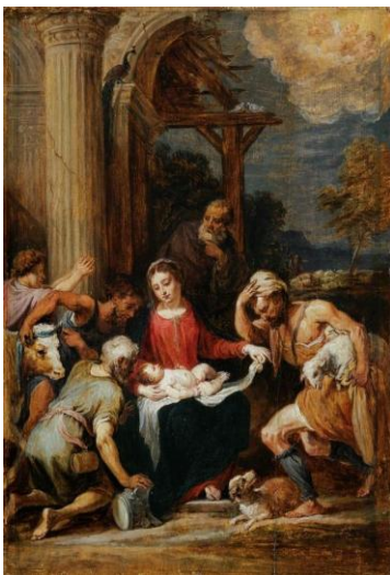
12. David Teniers le Jeune (Anvers 1610 - 1690 Bruxelles), Adoration des bergers , d'après Andrea Schiavone ; 31,2 x 21,2 cm ; inv. 5796