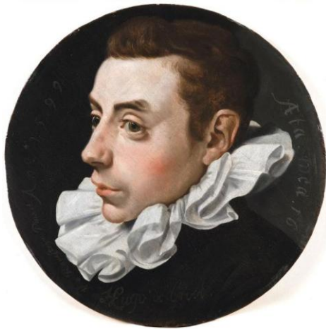
2. Jan van Ravesteyn (La Haye vers 1572 - 1657 La Haye) Portrait d'Hugo Grotius âgé de 16 ans , 1599 diamètre: 31 cm ; inv. 175