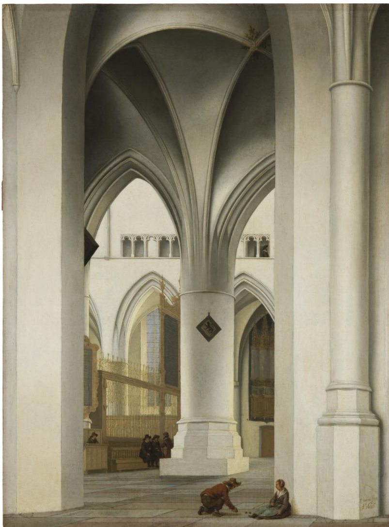
Pieter Jansz Saenredam (Assendelft 1597 - 1665 Haarlem) Intérieur de l'église Saint-Bavon de Haarlem, 1636