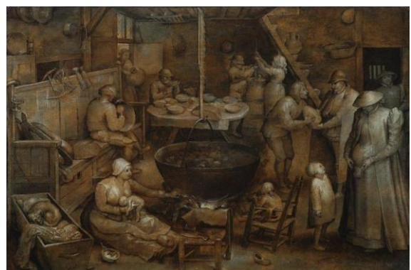
10. Jan Brueghel l'Ancien, dit « de Velours » (Bruxelles 1568 - 1625 Anvers) La Visite à la métairie 28,5 x 42,7 cm ; inv. 431