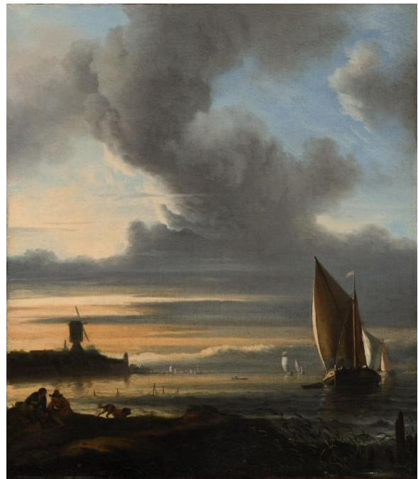
4. Ludolf Backhuysen (Emden 1630 - 1708 Amsterdam) Vue d'un canal avec des voiliers et un moulin 41 x 38 cm ; inv. 1919