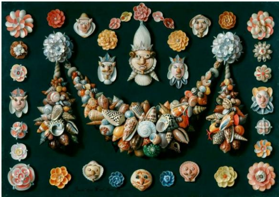
11. Jan van Kessel l'Ancien (Anvers 1626 - 1679 Anvers), Festons, masques et rosettes de coquillages , 1656 ; 40 x 56 cm ; inv. 5824